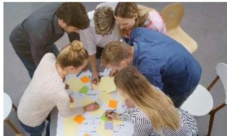
Zusammen Lösungen finden

Wer sein Kind taufen lassen möchte, kann sich aussuchen, in welcher Gemeinde die Taufe stattfinden soll. Bei Beerdigungen hat sich das System gut eingespielt, welche Pfarrerin bzw. welcher Pfarrer jeweils dran ist. Wir feiern fröhliche und besinnliche Gottesdienste miteinander: Der Gottesdienst zu Swing im Park hat die längste Geschichte, der Gottesdienst zum Marktfest zieht Besucher aus allen Kirchengemeinden an. Der Gottesdienst für Trauernde etabliert sich gerade erst. Bei seinem ersten Mal war er sehr gut besucht aus allen vier Gemeinden.