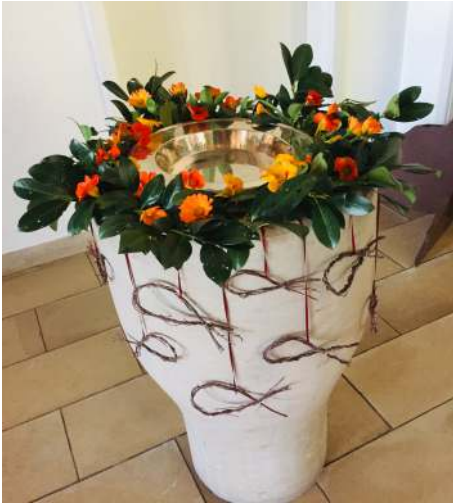
Taufstein Friedenskirche Wildenheid