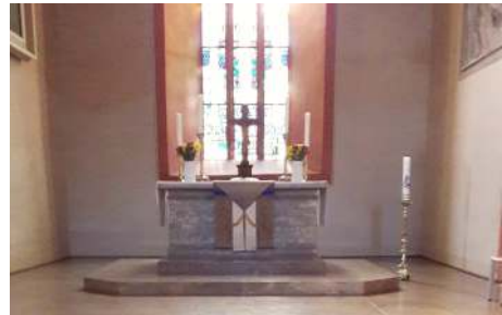
Altar St. Georg Neustadt

22. März 10.00 Uhr Vorstellungsgottesdienst Muss leider wegen adT Infektionsschutz ausfallen. 18.00 Uhr Vorstellungsgottesdienst Friedenskirche Wildenheid