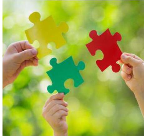
Menschen brauchen andere Menschen

Jesus schickt keine Einzelkämpfer los, sondern zwei. Zwei sind besser als einer. Das steht in unserer Bibel schon ganz am Anfang. Menschen brauchen andere Menschen, sind auf andere angewiesen, leben von anderen Menschen, leben auf durch andere.