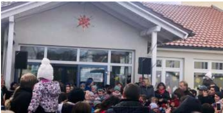
Für die Kleinen gab es ein liebevolles Programm.

Anschließend konnte man sich nicht nur an Spezialitäten und Leckereien erfreuen, sondern auch an einem weihnachtlichen Programm der Grundschule, von Hand gefertigten Adventsdekorationen sowie winterlichen Accessoires und guten Gesprächen. Ebenfalls wurde für die Kleinen ein liebevolles Programm gestaltet mit Plätzchen backen, Tombola, Kinderschminken und Adventsgeschichten. Für die Größeren gab es zwei Escape-room-Spiele, so dass für jeden etwas geboten war.